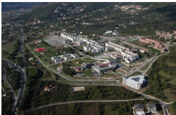
Campus di Fisciano

Di non secondaria importanza è il servizio di pronto intervento 24h su 24h , ritenuto incluso nelle operazioni a canone, che rappresenta il miglior modo per far fronte a tutte quelle situazioni di guasto che quotidianamente investono una realtà così articolata e complessa come quella dell'Università di Salerno ed i suoi due Campus di Fisciano e Baronissi.