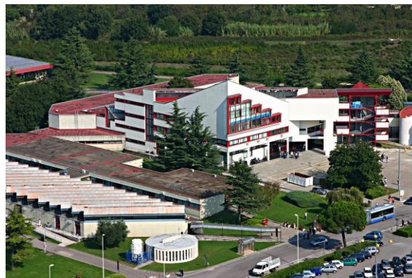
Campus di Baronissi

L'Università di Salerno si è evoluta tecnologicamente in maniera molto rapida nell'ultimo decennio per rispondere in modo adeguato alle esigenze che emergono dall'attuale organizzazione dei servizi e della didattica. Le nuove tecnologie ed in particolare i nuovi impianti di automazione nel senso più generico, che rappresentano il futuro dell'infrastruttura, hanno bisogno di una manutenzione adeguata e che sia in grado, tra l'altro, di evolversi coerentemente alla novità tecnologiche.