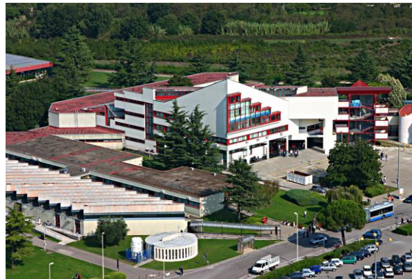
Campus di Baronissi

L'Università di Salerno si è evoluta tecnologicamente in maniera molto rapida nell'ultimo decennio per rispondere in modo adeguato alle esigenze che emergono dall'attuale organizzazione dei servizi e della didattica. Le nuove tecnologie ed in particolare i nuovi impianti di automazione nel senso più generico, che rappresentano il futuro dell'infrastruttura, hanno bisogno di una manutenzione adeguata e che sia in grado, tra l'altro, di evolversi coerentemente alla novità tecnologiche.